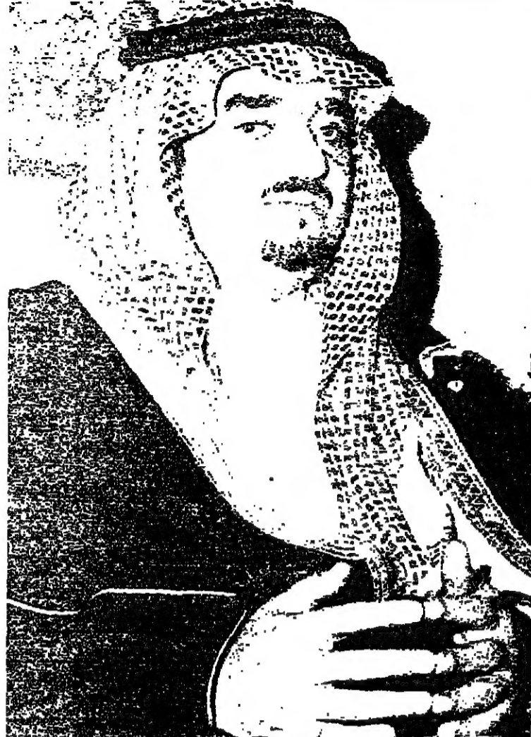
الامير فهد ويسام فرجه اسماء الحبيب

وكما اتنا مستعدون للمساهمة في بناء احتياطي النفط لضمان مستقبل الصناعة والحضارة في الولايات المتحدة ، فالطلب من اميركا ان تساهم في ضمان مستقبل بلادنا ورفع مستواها عن طريق التعمد مشاريع الانشاء والتطوير ، وتحريك الشركات الاميركية باتجاه هذا الهدف